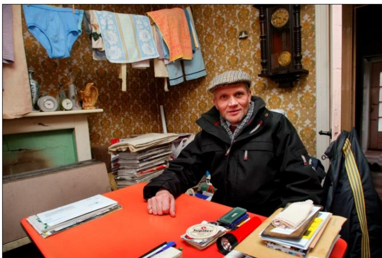
De foto uit ons fotoboek ...