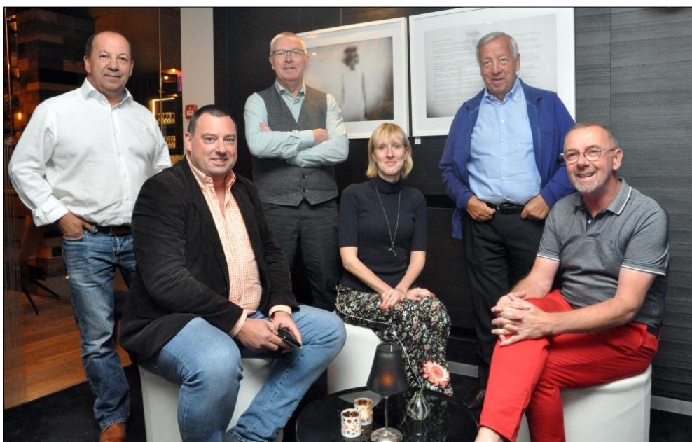
Bestuur TPK 2019